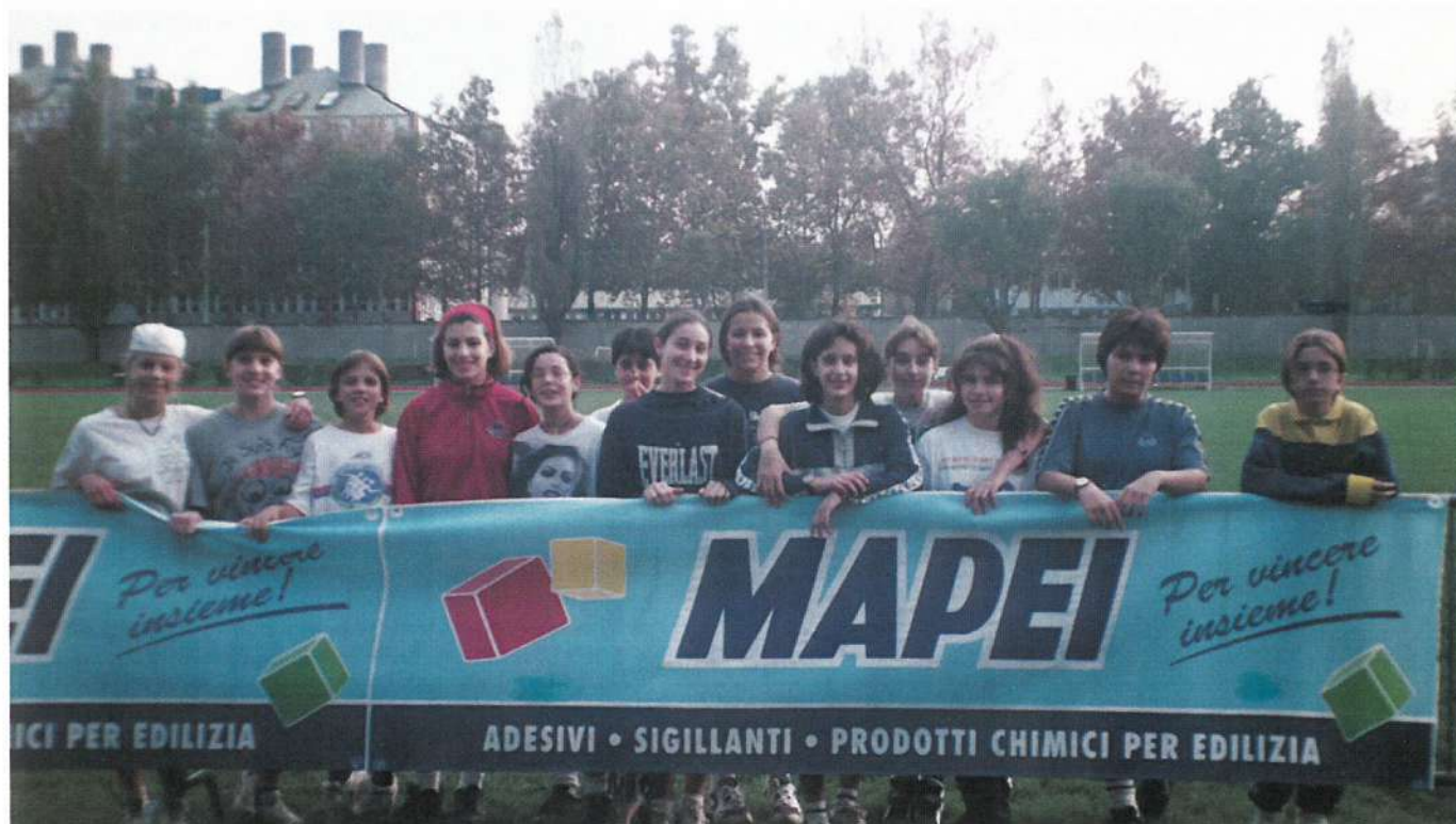
Alcuni dei partecipanti alla Leva Olimpica MAPEI svoltasi al campo Giuriati il 9 novembre.